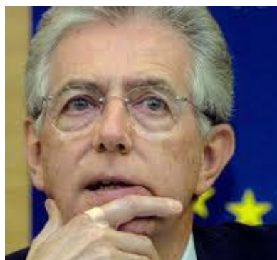
Mario Monti, Italiens nuvarande regeringschef tillika finansminister

Efter höstens spanska parlamentsval har en ny regering tillträtt med premiärminister Mariano Rajoy i spetsen. Starten för den nya regeringen kunde knappast varit sämre. Nya siffror visar på en markant försvagning av